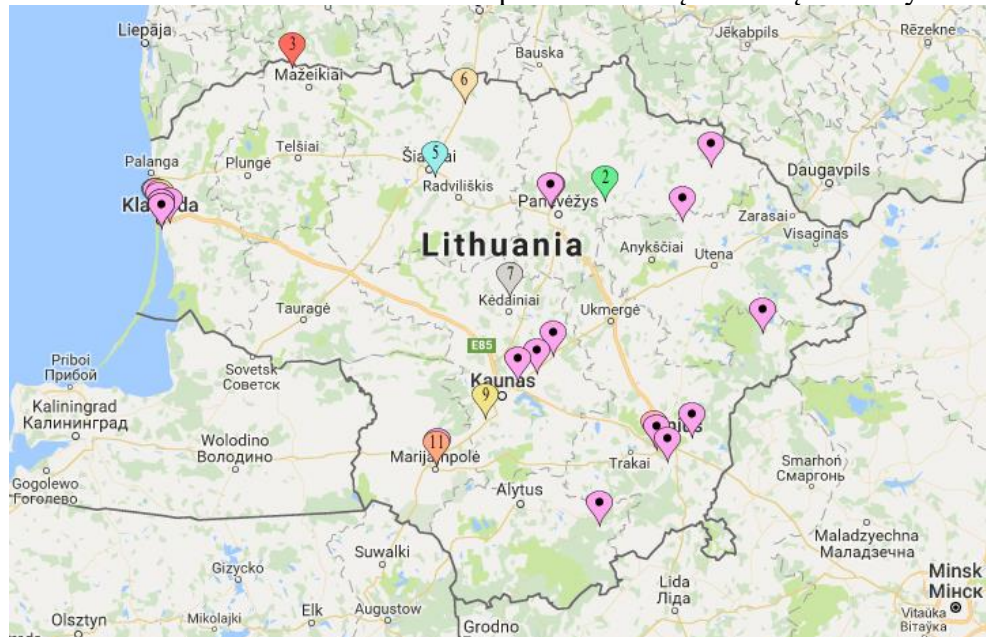
2 pav. Akcizinių sandėlių išsidėstymas Lietuvoje.